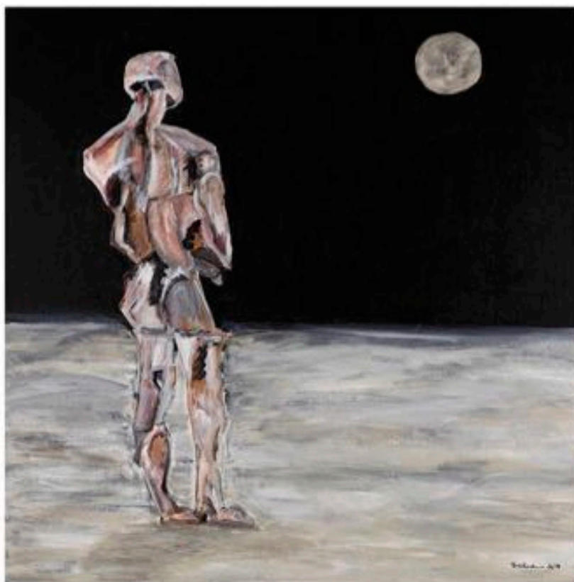
YEARNING ( de la série «Emotions» ), 2014, acrylique sur toile, recouvert de vernis satiné, 61 x 61 cm.