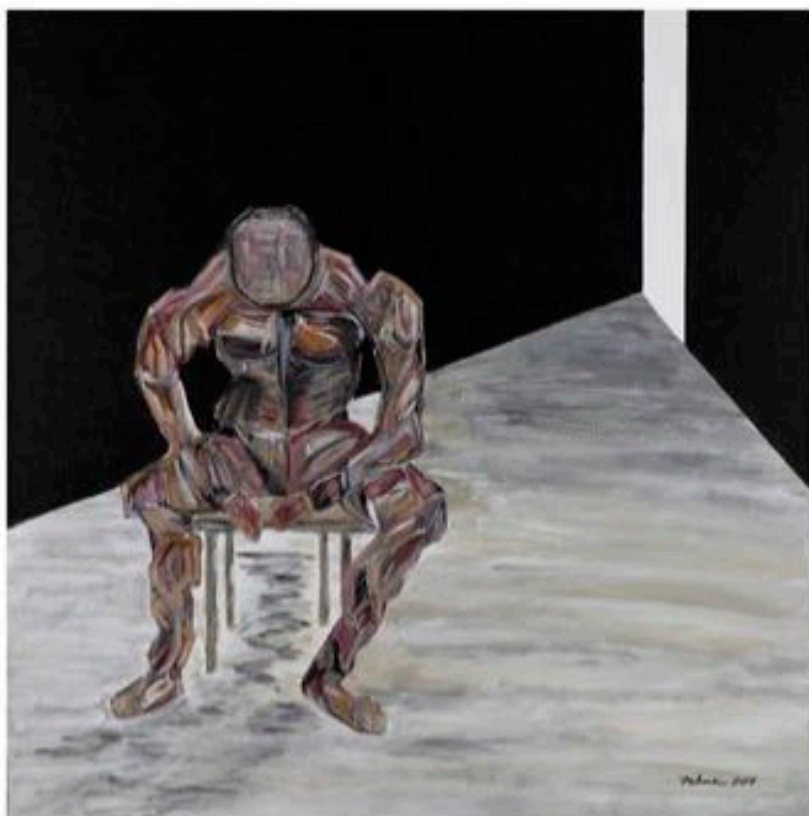
VOLITION ( de la série «Emotions» ), 2014, acrylique sur toile, recouvert de vernis satiné, 61 x 61 cm.