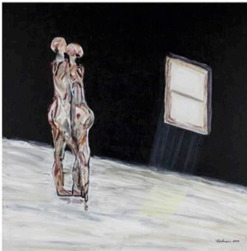
AMORE ( de la série «Emotions» ), 2014, acrylique sur toile, recouvert de vernis satiné, 61 x 61 cm.