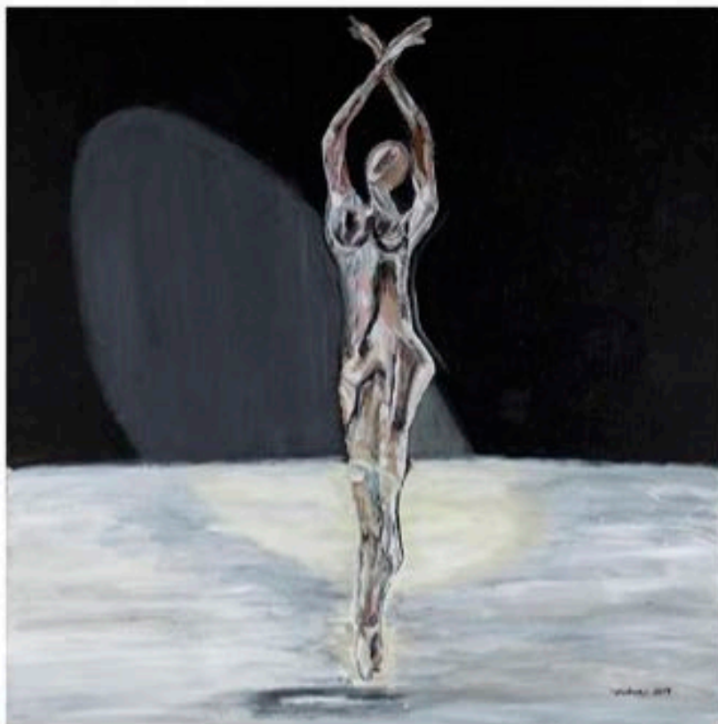
LIBERA ( de la série «Emotions» ), 2014, acrylique sur toile, recouvert de vernis satiné, 61 x 61 cm.